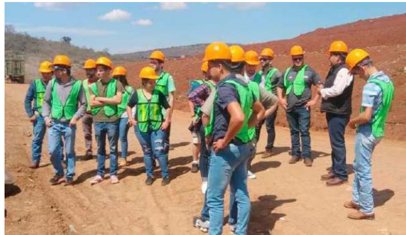
Recorrido por instalaciones del SIMAR Sureste a pobladores de la localidad de Tepec, Amacueca para conocer la operación del relleno sanitario intermunicipal.

como parte de los acuerdos establecidos en convenio de cooperación, y de los acuerdos tomados en el Primer Encuentro entre Grupo Francia–México para la cooperación descentralizada, celebrado en el mes de octubre en la ciudad de Guanajuato, Guanajuato.