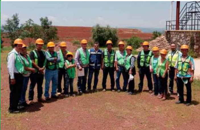
Visita de estudiantes al relleno sanitario intermunicipal SIMAR SURESTE.