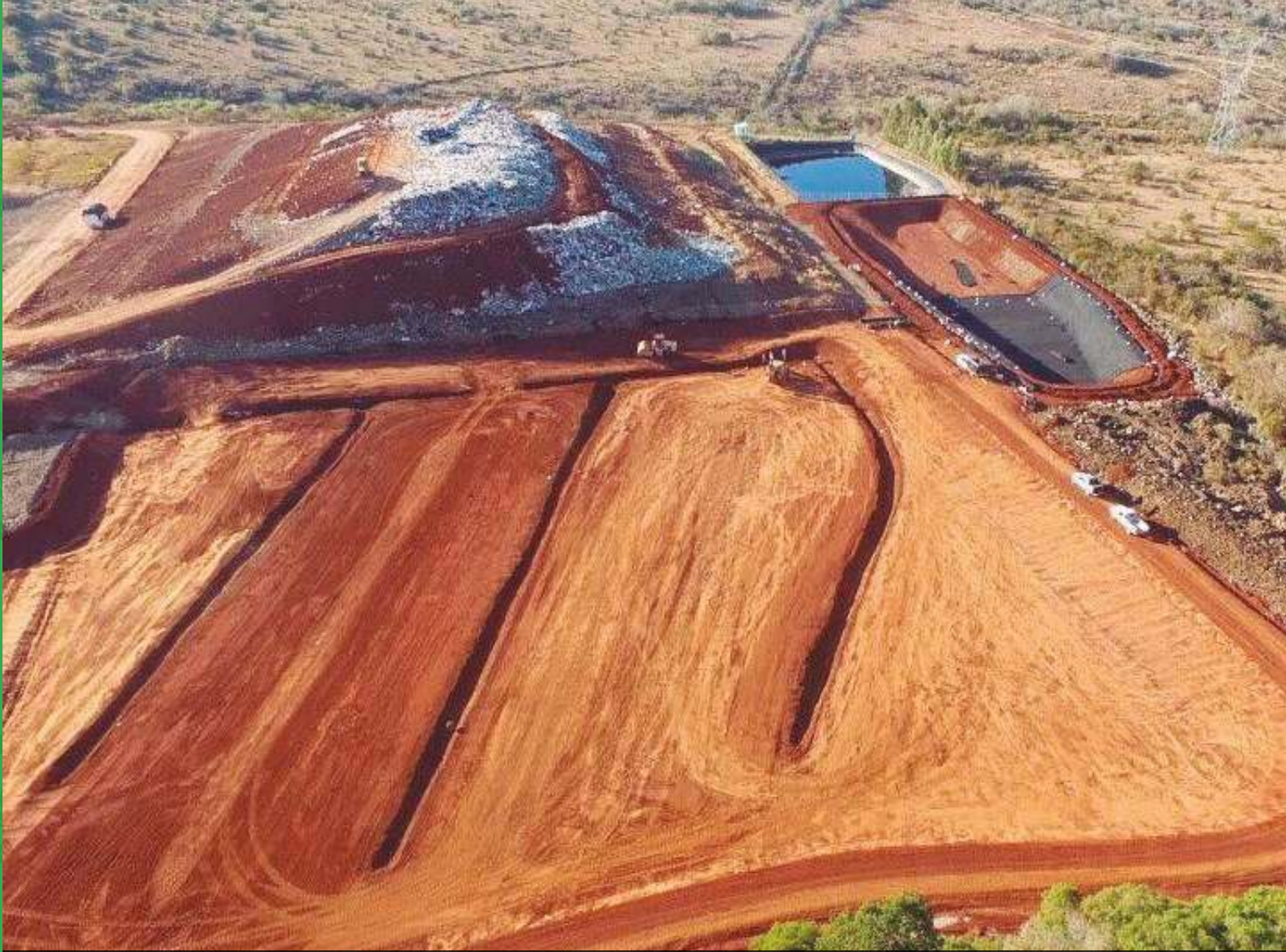
Obras de ampliación celda II relleno sanitario intermunicipal SIMAR Sureste, y trabajos de conformación de taludes celda I para su cierre y abandono de conformidad con los establecidos por la normatividad ambiental vigente, 2018.

Gestión Integral de Residuos en el país, que establecía líneas estratégicas y dirección para el cumplimiento de sus objetivos y metas.