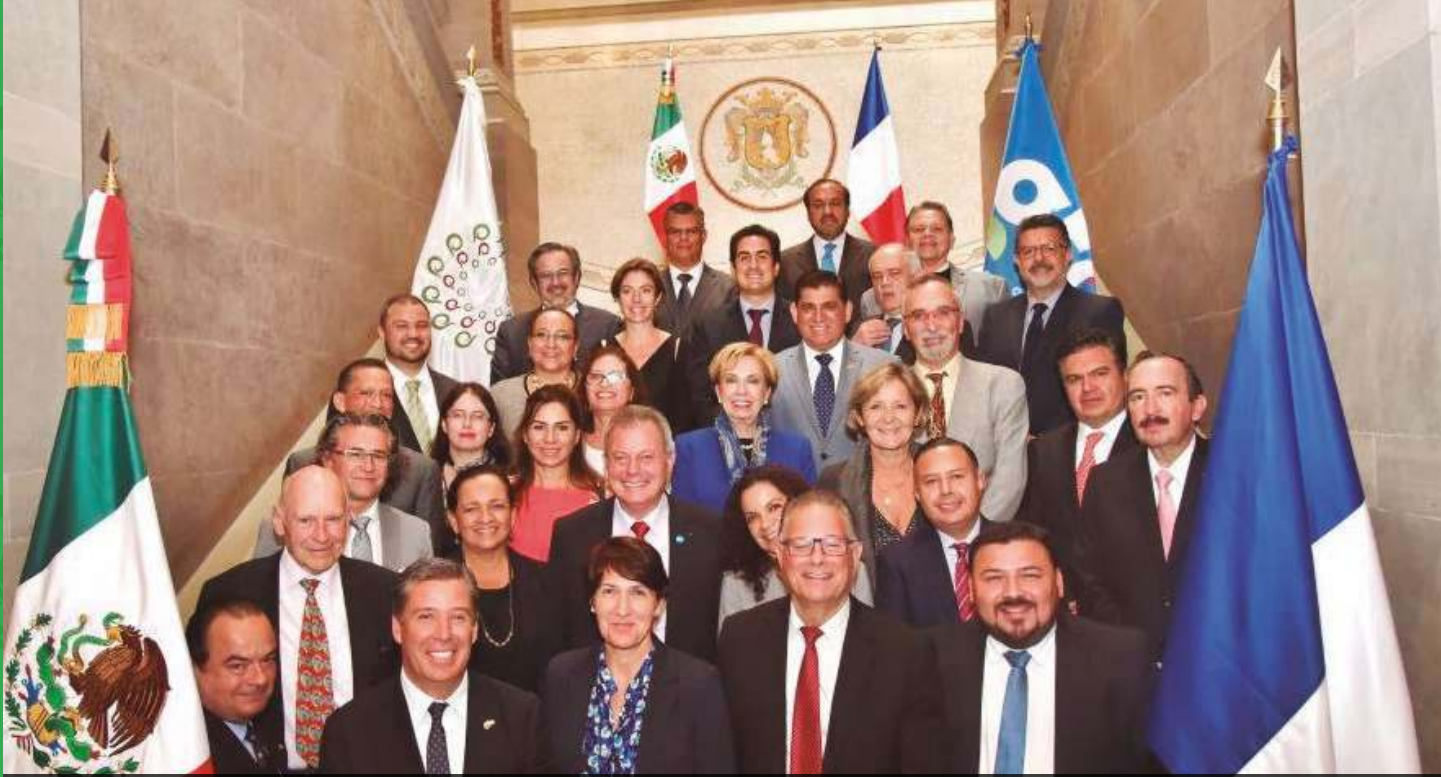
Presentación de la experiencia de la Communauté d'Agglomération Tarbaes, Lourdes, Pyrénées y SIMAR Sureste, en el marco del Primer Encuentro entre Grupo Francia . México para la Cooperación Descentralizada, Guanajuato, Gto. Octubre 2017

profesionistas e investigación en la materia; y una cultura de minimización en la generación.