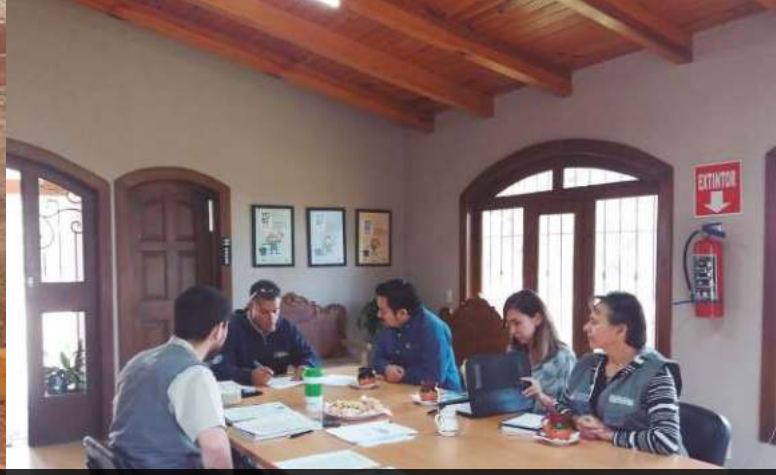
Visitas técnicas de la Secretaría de Medio Ambiente y Desarrollo Territorial, para la supervisión de acciones para la Re-certificación del Certificado de Cumplimiento Ambiental Voluntario de las instalaciones de relleno sanitario intermunicipal, estación intermunicipal de transferencia de residuos y oficinas de la intermunicipalidad.

El día 17 de enero del 2018, recibimos a técnicos de la Dirección de Residuos de la Secretaría de Medio Ambiente y Desarrollo Territorial del Estado de Jalisco, para realizar recorrido de supervisión a la obra de construcción de la celda II del relleno sanitario intermunicipal SIMAR Sureste.