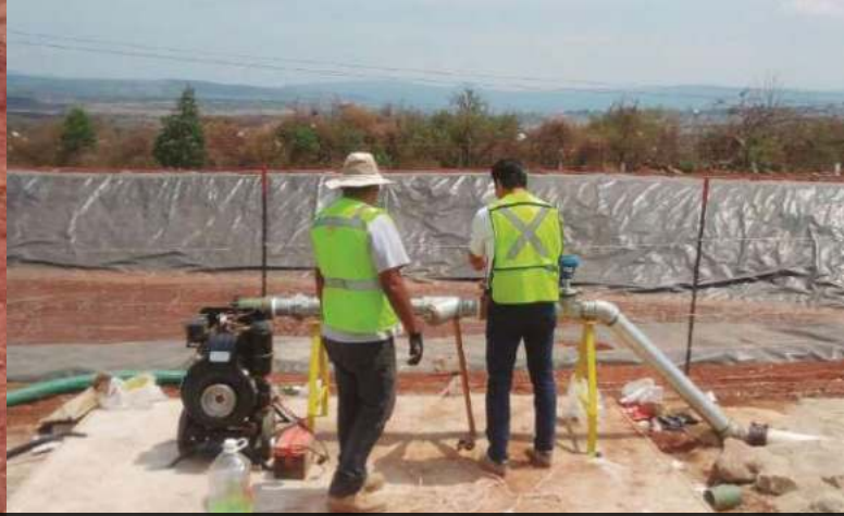
Instalación del sistema de recirculación de lixiviados para celda II del relleno sanitario intermunicipal.

dos. Durante su visita recibieron una charla del esquema asociativo, financiero, legal y operativo del organismo. Y realizaron recorrido por las instalaciones del relleno sanitario intermunicipal, estación de transferencia y centro de acopio en Mazamitla.