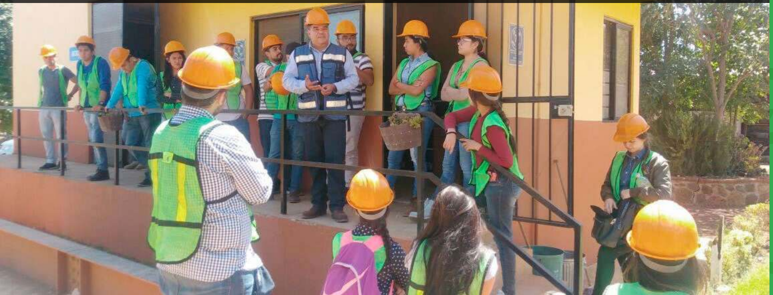
Recorridos explicativos a jóvenes estudiantes interesados en conocer la gestión integral de residuos sólidos del SIMAR Sureste

El día 22 de febrero del 2018, atendimos la visita de estudiantes del Centro Universitario de la Universidad de Guadalajara en Tepatlán, para conocer el modelo de cooperación intermunicipal para la gestión de residuos sólidos.