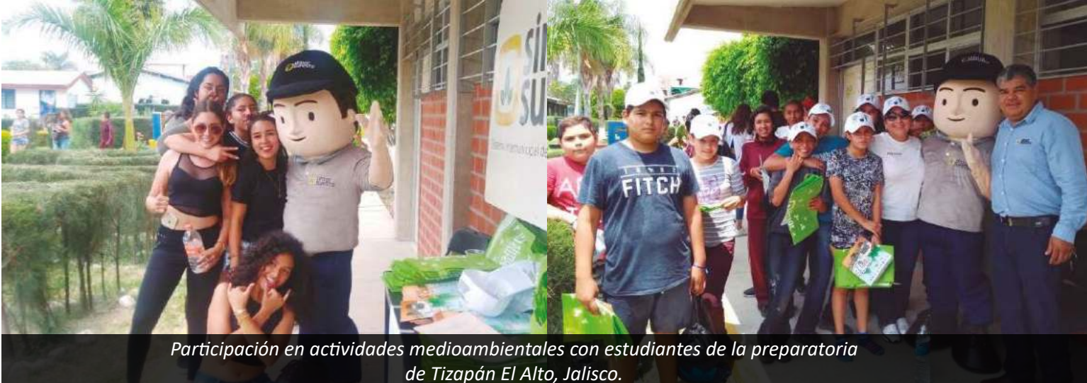
Participación en actividades medioambientales con estudiantes de la preparatoria de Tizapán El Alto, Jalisco.

El día 30 de mayo del 2018 se recibió a funcionarios de los municipios que conforman la SIMAR Lagunas, a fin de compartir experiencias para resolver el problema social en la comunidad de Tepec, municipio de Amacueca, que se oponen a la construcción y operación del relleno sanitario en esa zona.