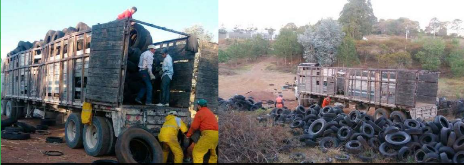
Desalajo de neumáticos usados acopiados en los centros de acopios intermunicipales de la SIMAR Sureste, para su transporte y tratamiento en hornos de cemento como combustible alterno.

La Estación Intermunicipal de Transferencia de Residuos Sólidos (ETR) recibe todos los días residuos recolectados por los municipios de Tuxcueca, La Manzanilla de la Paz, Teocuitatlan de Corona, Concepción de Buenos Aires y algunas delegaciones del municipio de Tizapan El Alto. En promedio reciben cerca de 21.53 toneladas de residuos sólidos diarios, esto representa un 29.15% del total de los residuos generados a nivel de la intermunicipalidad, trasladados al relleno sanitario regional para su manejo adecuado y confinamiento.