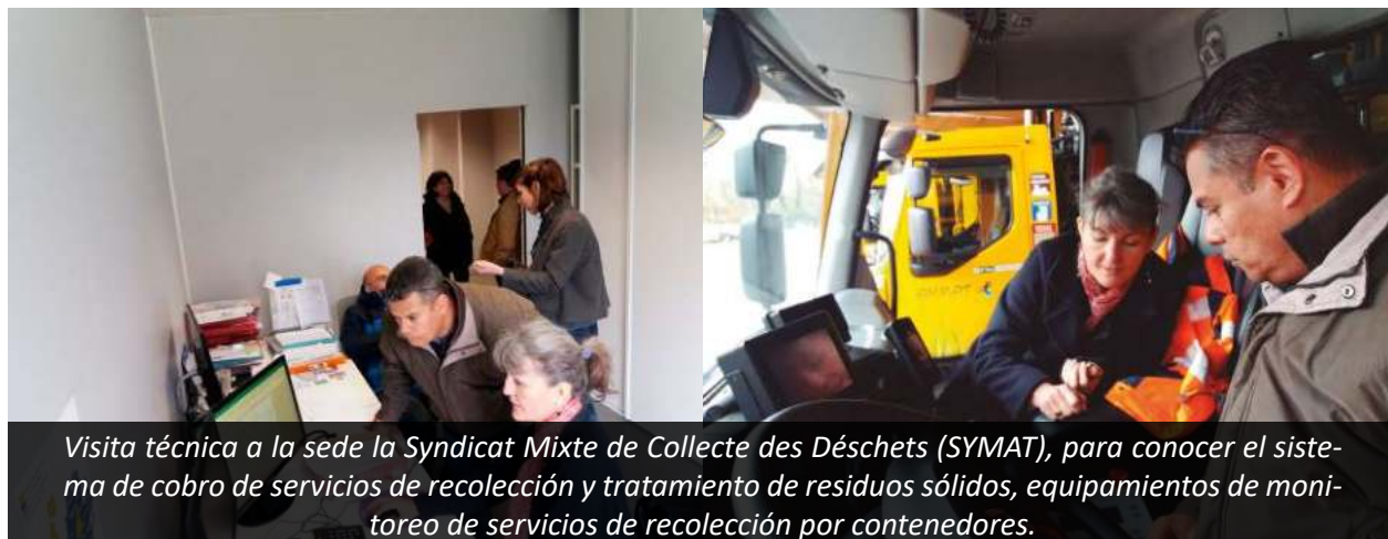
Visita técnica a la sede la Syndicat Mixte de Collecte des Déchets (SYMAT), para conocer el sistema de cobro de servicios de recolección y tratamiento de residuos sólidos, equipamientos de monitoreo de servicios de recolección por contenedores.

ción de Lourdes, Francia. Con estos encuentros internacionales se pretende aplicar acciones de promoción turística de Mazamitla y los municipios que conforman el Simar Sureste en Francia. El turismo europeo es una oportunidad para la región y el desarrollo local sostenible.