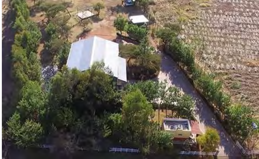
Ingreso a las instalaciones de transferencia de residuos sólidos