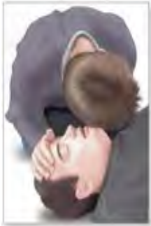
Observar, escuchar y sentir la respiración