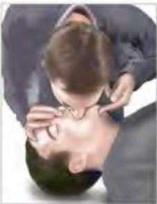
Colocar la boca sobre la boca de la víctima y exhalar

6. Observar, escuchar y sentir si hay respiración. Poner el oído cerca de la nariz y boca de la persona. Observar si hay movimiento del pecho y sentir con la mejilla si hay respiración.